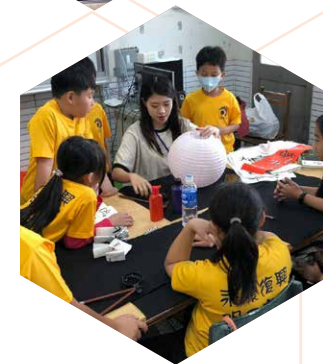
台南大學國語文系 / 國小學生關懷輔導課輔計畫 / 示範燈籠彩繪