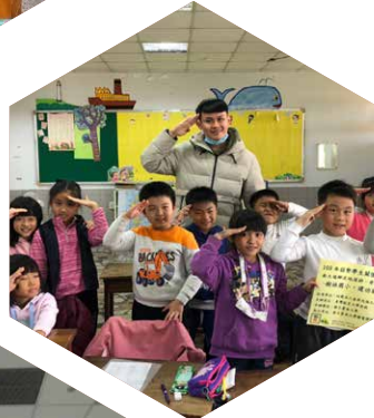
台南大學／ 偏鄉在地深耕 希望生根課輔計畫— 建功國小課輔