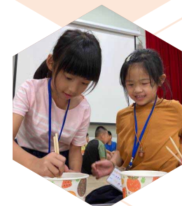
臺北市立大學 / 師資生弱勢學生關懷 輔導課輔計畫