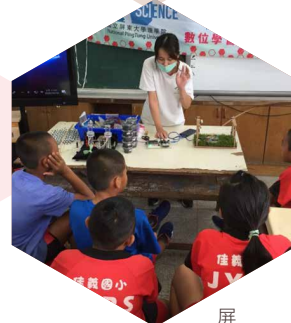
屏東大學應用化學系／ 奈米科技與科學教員體驗營— 佳義國小