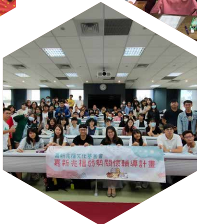
台東大學／ 以數位學習習家族協助東部 地區弱勢學生學習計畫