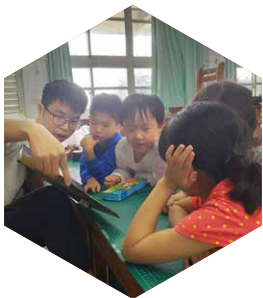
屏東大學心輔系／ 佳佐國小偏鄉課輔