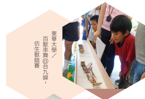
東華大學 / 百獸率舞@台九線 / 仿生獸競賽