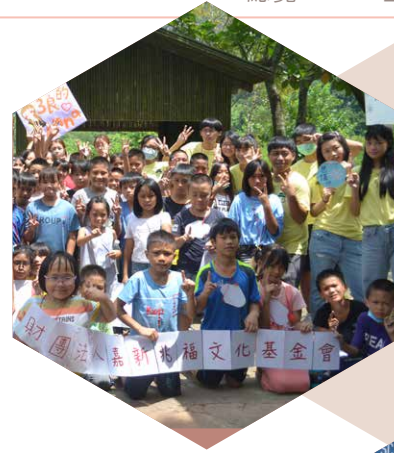
台北市立大學／ 冰雪奇緣生活美學探索學習成長營