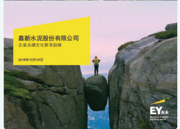
· 安永氣候永續部門－企業永續教育訓練與規劃