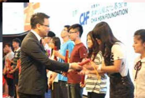
△ 嘉新清寒獎學金大學組