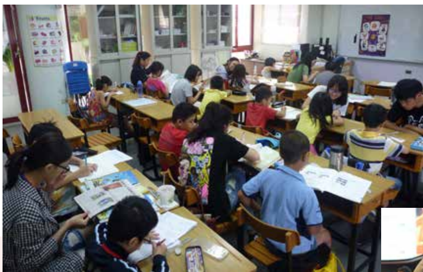
△ 週末兒童課輔 (台中西屯長安國小)