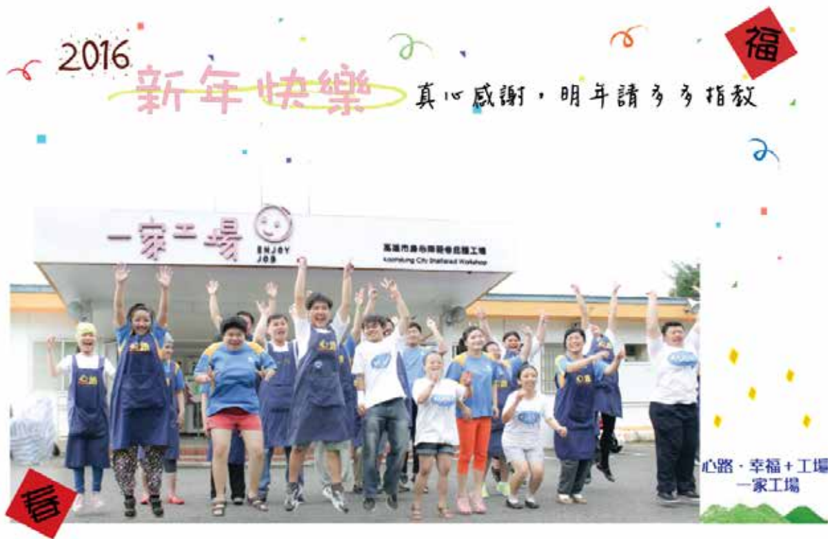
△ 心路基金會－城市養蜂計畫