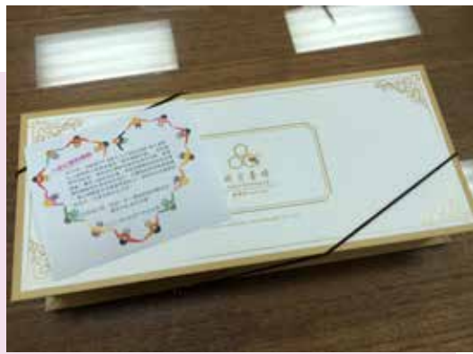
△ 年節禮盒－城市養蜂手工皂