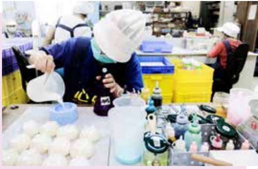
△ 心路基金會－製作手工香皂實錄

嘉新水泥為響應慈善公益向來不遺餘力，不時將三節年節禮品等大宗採購向弱勢團體訂購，並選擇環保、綠色商品，以直接行動鼓勵弱勢團體，支持環保商品。藉助此種幫助就業、回饋社會、保護環境和多贏的絕佳互惠商業模式實現企業社會責任。