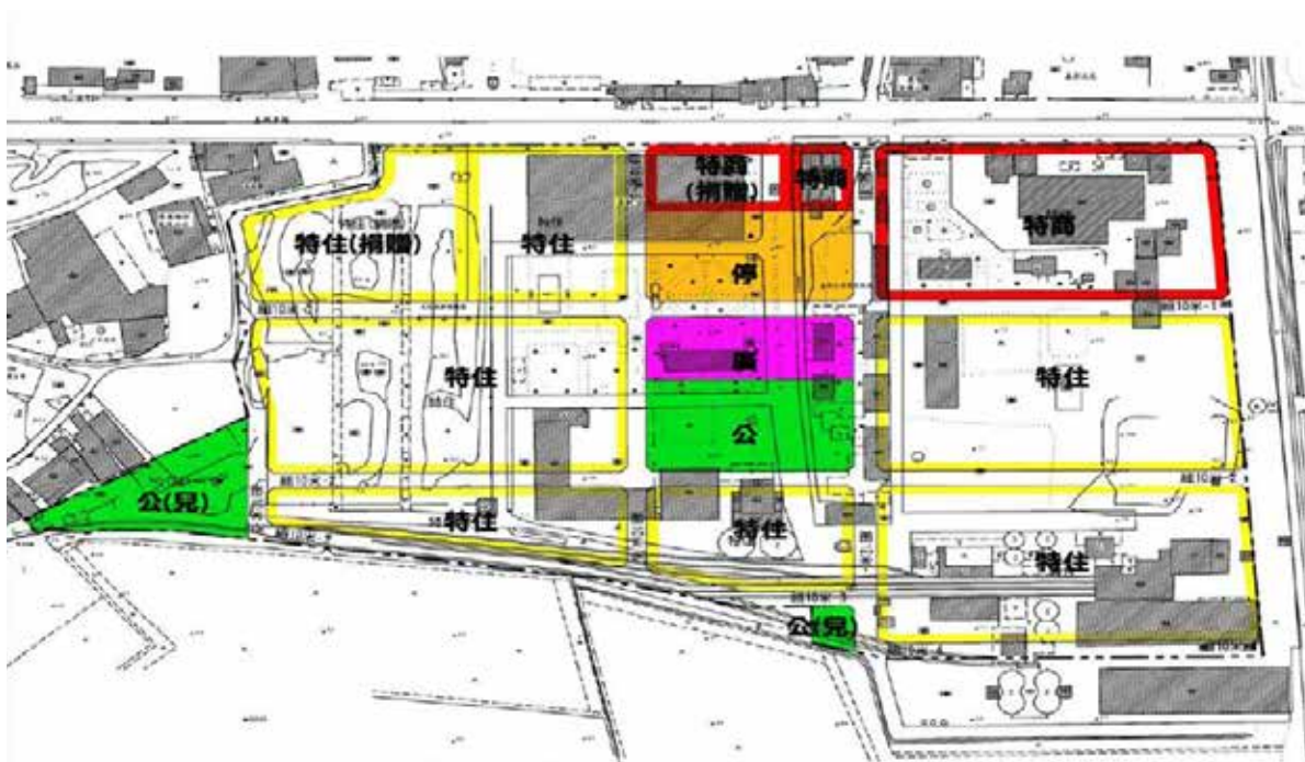
△ 北高雄宜居衛星城 建構高質商業樂活宅熱點 產業創新先驅據點 岡山生態門戶觀光新亮點