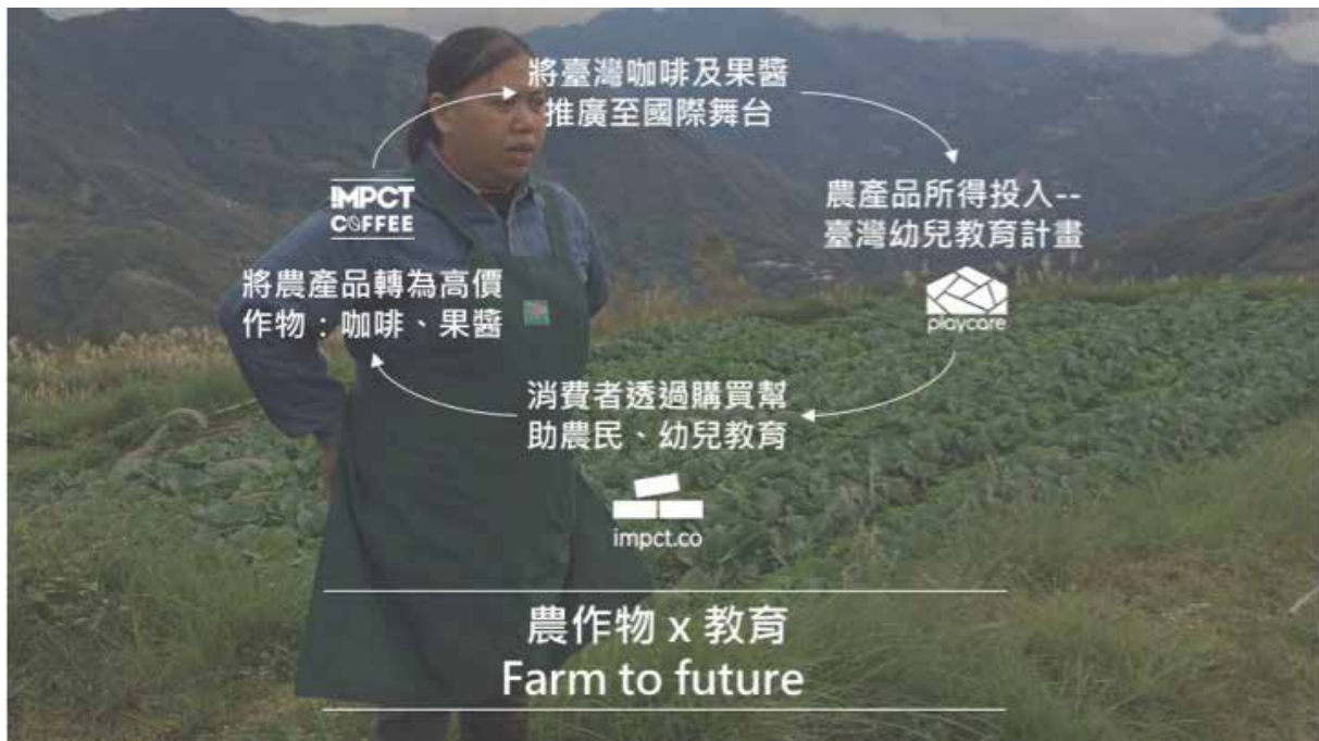
△ IMPCT 計畫－透過大量購買咖啡商品經濟，回饋台灣弱勢與貧國建造幼兒園，深耕在地幼兒教育