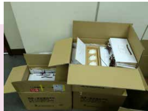
△ 年節大宗訂購－致贈外部往來廠商客戶，傳播分享愛