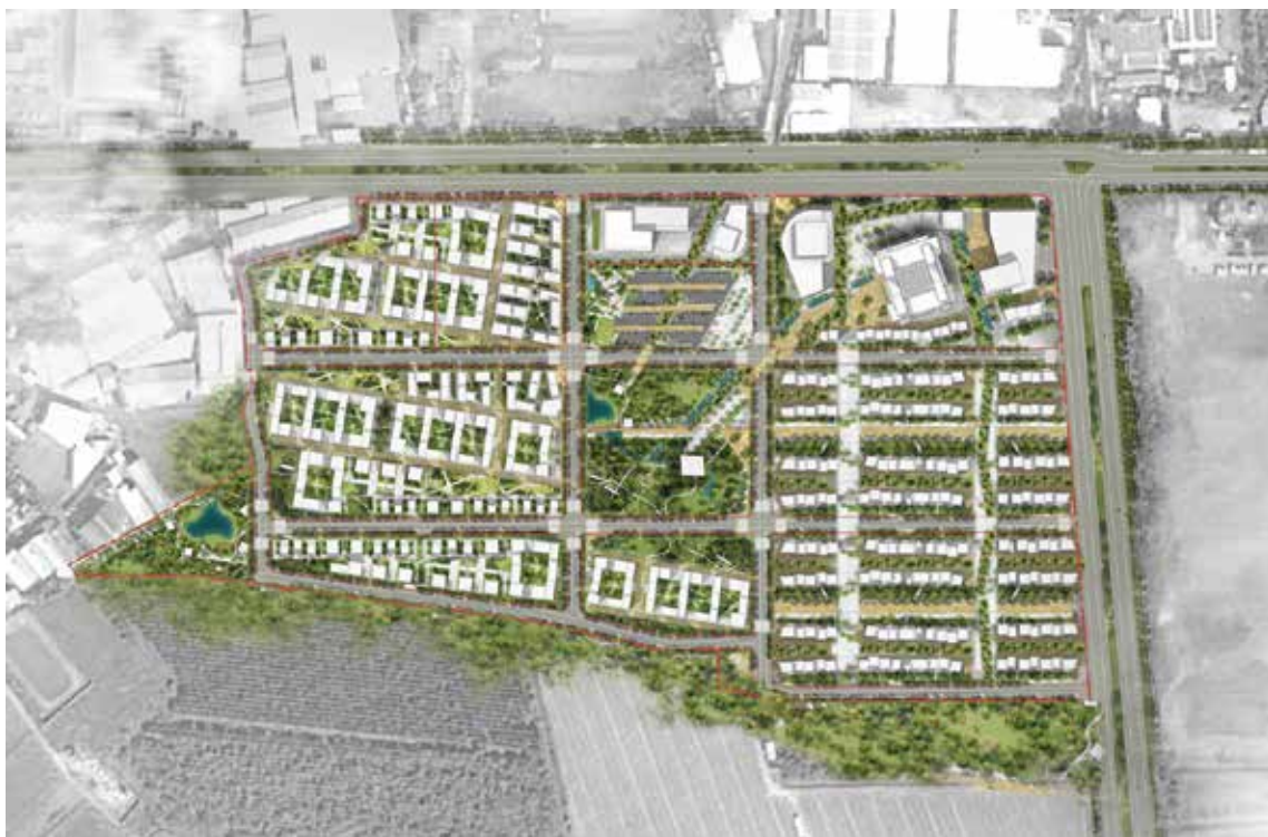
△ 座落高雄岡山都市計畫區之東北側入口門戶計畫面積達 16 公頃 配合都計通盤檢討，報送第十次都市計畫專案小組審議中