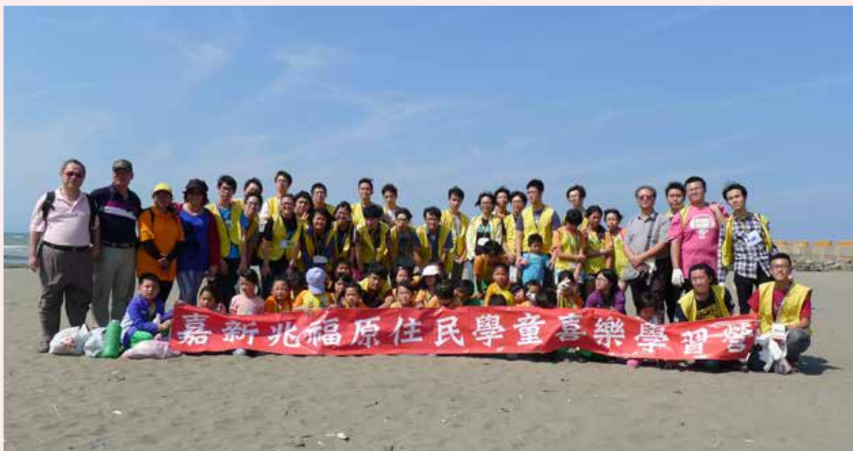
△ 后厝週末兒童課輔 - 桃園竹圍海灘淨灘