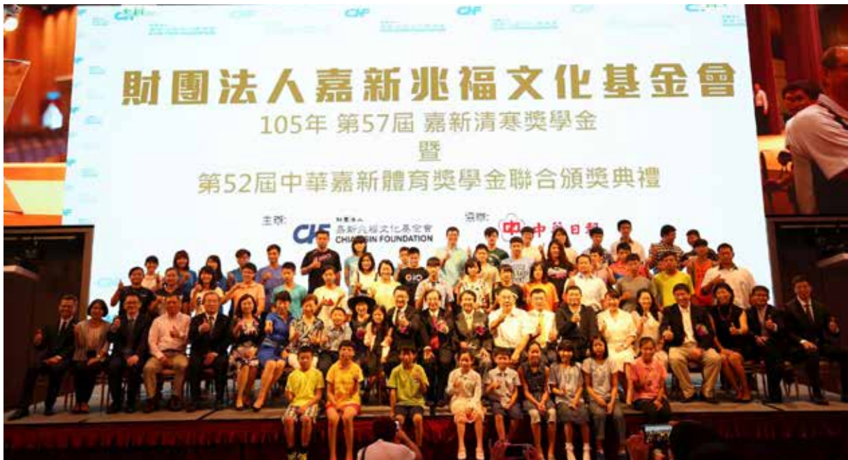
△ 嘉新清寒獎學金－得獎人和與會貴賓、頒獎人合影